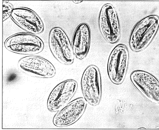
Fig. 2. Infective pinworm eggs.

Sá tími sem lirfur njálgsins geta lifað í eggjunum fer eftir hita- og rakastigi umhverfisins. Þar sem rakt er og kalt geta eggin verið smithæf í eina til tvær vikur eftir að þeim var verpt en eftir því sem heitara er og þurrara drepast lirfurnar fyrr inni í eggjunum (20–23). Rannsóknir hafa sýnt að lirfur í meira en 90% njálgseggja eru þegar dauðar eftir tvo daga í stofuhita þannig að innan við 10% eggjanna eru smithæf (22).